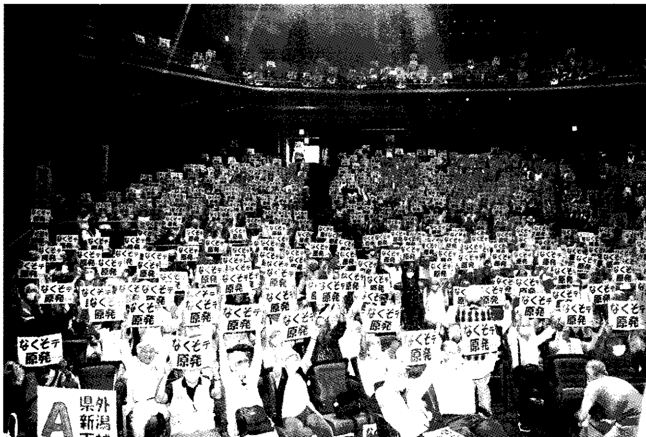
▲なくそテ原発 2025 柏崎大集会（柏崎市アルフォーレ、2025年9月21日）